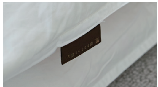
マスターウォールタグ

羽毛はイングランド産のホワイトダックダウン 90%、フェザー 10%を使用。 軽量の側生地を使用し、立体キルトの形状でダウンのふんわり感を保ちます。 ダウンパワー 360